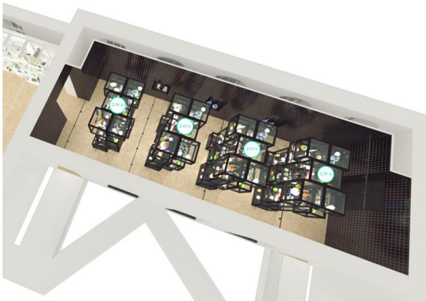
Moravská galerie v Brně -UMPRUM BLACK & LIGHT DEPO