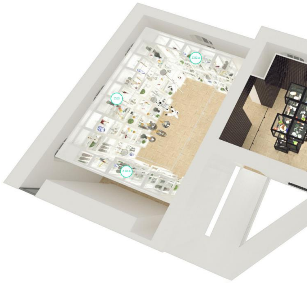
Moravská galerie v Brně -UMPRUM BLACK & LIGHT DEPO